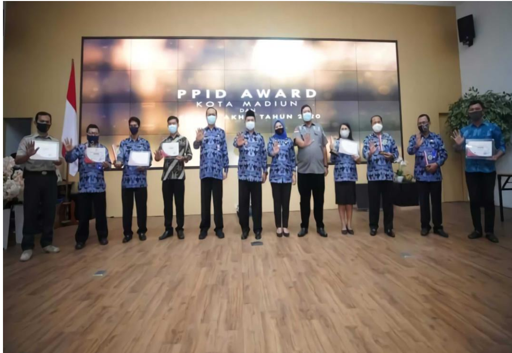
PPID Pembantu Kelurahan Josenan mendapatkan Juara III Tingkat Kota Madiun