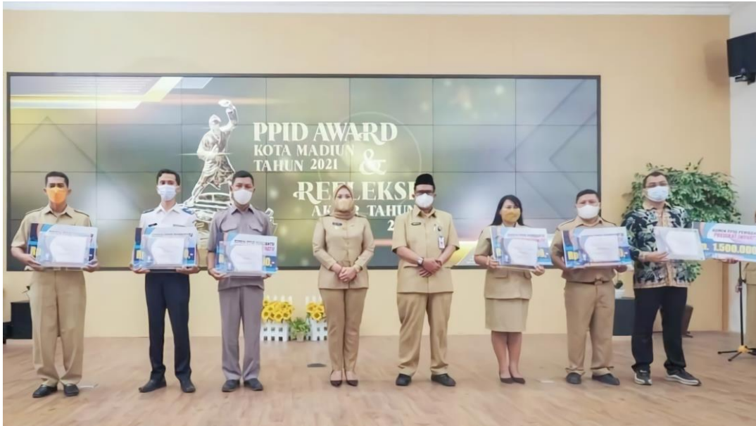
PPID Pembantu Kelurahan Josenan mendapatkan Juara II Tingkat Kota Madiun Tahun 2021